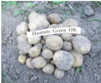
Humate Green OK

Attēli 1-2: Kartupeļu 'Madara' bumbuļu raža no 1 m 2