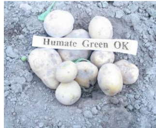
Humate Green OK

Attēli 3-4: Kartupeļu 'Madara' bumbuļu raža no 1 auga